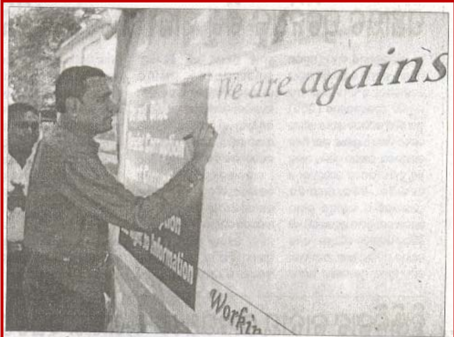
ଦୁର୍ନୀତି ବିରୋଧ ସମ୍ପାଦ ଉପଲକ୍ଷେ ବ୍ରହ୍ମପୁରରେ ଦସ୍ତଖତ ଅଭିଯାନ : ଭିକିଲାକୁ ଏସପି ଦସ୍ତଖତ କରି ଅଭିଯାନକୁ ଶୁଭାଗମ କରୁଛନ୍ତି ।